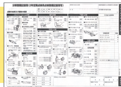
自家用乗用車の点検整備(分解整備)記録簿

これはいわば、クルマの健康カルテ。エンジンやブレーキをはじめ、さまざまな箇所の点検・整備の内容が記録されています。